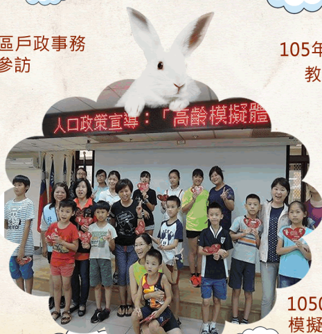
1050730高齡 模擬體驗活動