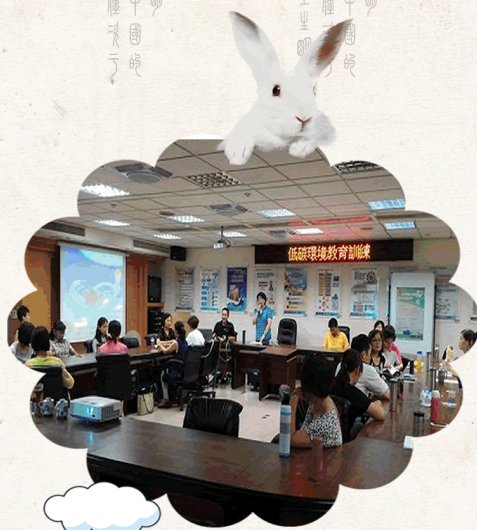
1050702探索環境擁抱健康與過勞之預防 綜合性教育訓練