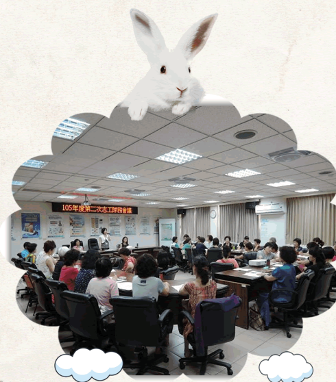
105年度第二次志工隊務會議、 教育訓練暨戶政業務宣導