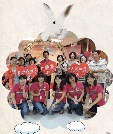
1050714至西區戶政事務 所業務參訪