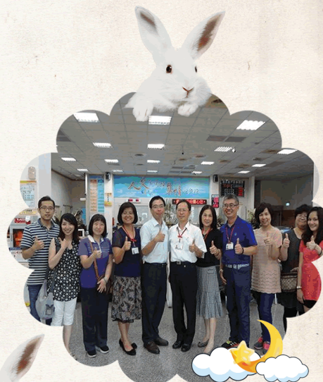
1050728至清水戶政事務所業務參訪